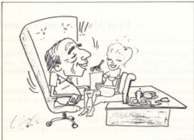
Hy sien sy vriendelike sekretaresse net op haar beste.

is nie. Hy sien haar ook nie wanneer sy in 'n tirade uitbars teenoor die kinders wat nou net die laaste strooi was nie.