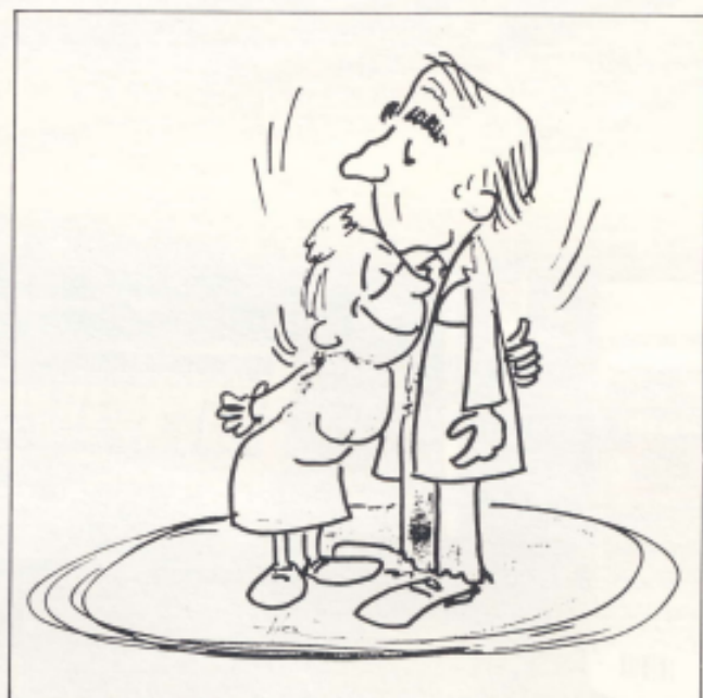
Die huisarts se vrou is gewoonlik meer afhanklik en met 'n groter behoefte aan liefde en toenadering as die deursnee vrou.

Hy kan dus so sy praktyk gebruik om homself af te sonder van sy gesinsverpligtinge.