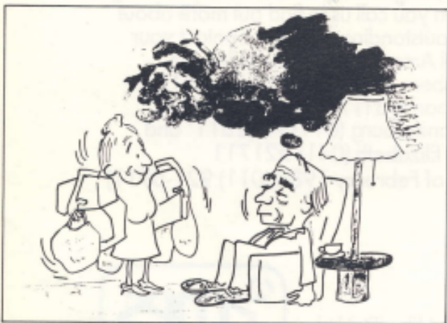
Sy reageer deur goed te wil lewe — net die beste is goed genoeg.

— Praktyk is 'n beter verskoning as 'n hoofpyn om weg te bly van die skoolsluiting, van die vervelige geselskap of van die konsert.